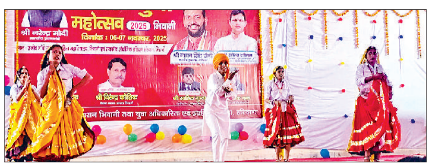
भिवानी। हरियाणवी नृत्य की प्रस्तुति देते विद्यार्थी।