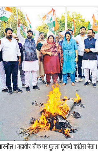
नारनौल। महावीर चौक पर पुतला फूंकते कांग्रेस नेता।