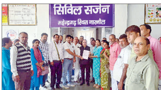
सिविल सर्जन महेंद्रगढ़ स्थित नारनौल