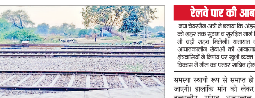
बवानीखेड़ा ढाणी क्षेत्र की वह जगह, जहां अंडरपास का निर्माण होगा।