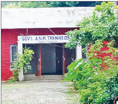
नारनौल। एएनएम ट्रेनिंग स्कूल का भवन।

एएनएम स्कूल को जीएनएम ट्रेनिंग स्कूल का दर्जा दे दिया जाता तो जीएनएम कर रही बच्चियों को प्राइवेट फीस से काफी हद तक राहत मिल सकती थी।