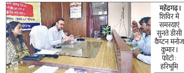
हरिभूमि न्यूज़ महेन्द्रगढ़