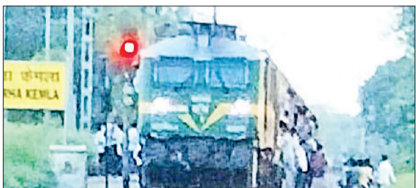
कनीना। बीकानेर रेलमार्ग पर गुड्डा केमला समपार रेलवे फाटक से गुजरती रेल।