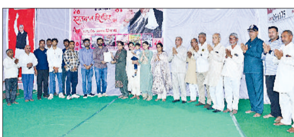
भिवानी। रक्तदाताओं को प्रमाण पत्र देकर सम्मानित करते भक्तजन।