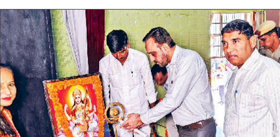
नारनौल। कार्यक्रम का शुभारंभ करते डीसी व कार्यक्रम में अपनी प्रस्तुति देती छात्राएं

उन्होंने कहा कि यह मंच आपको अपनी रचनात्मकता को व्यक्त करने, अपनी कमजोरियों को पहचानने और एक-दूसरे से सीखने का अवसर देता है। कार्यक्रम का शुभारंभ उपायुक्त ने दीप प्रज्वलित किया गया। अंध महाविद्यालय की लड़कियों द्वारा रचाया गीत उपायुक्त के लिए गवायत किया। इसके बाद प्रिंसिपल राजकीय आईटीआई के द्वारा मुख्य अतिथि व सभी अन्य अतिथियों का स्वागत किया।