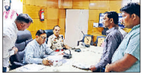
नारनौल। आमजन की शिकायत सुनते नगराधीश।